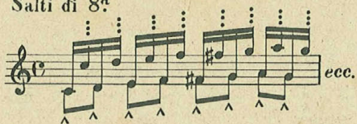
Salti di 8 a