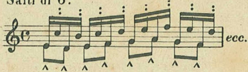
Salti di 6 a