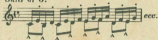
Salti di 3 a